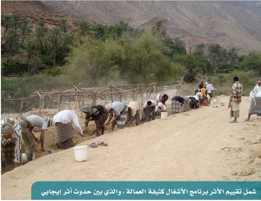
شمل تقييم الأثر برنامج الأشغال كثيفة العمالة ، والذي بين حدوث أثر إيجابي

نظم الصندوق في 8 يوليو 2013 ورشة عمل لعرض عدد من نتائج الدراسات التقييمية لتدخلات الصندوق في مجالات المياه والصرف الصحي والزراعة المطرية والثروة الحيوانية وبرنامج النقد مقابل العمل، بالإضافة إلى عرض التجربة الجديدة لوحدة المراقبة والتقييم في جمع البيانات عبر أجهزة الهاتف النقالة. حضر الورشة عدد من المنظمات الأجنبية والجهات الحكومية ذات العلاقة. تم خلال الورشة مناقشة النتائج التقييمية للتدخلات المذكورة، ومناقشة آراء واستفسارات المشاركين، والرَد عليها. وفي ختام الورشة، أكدت وحدة المراقبة والتقييم أهمية انعقاد مثل هذه الورش لأهميتها في نقل المعلومات وتبادل الخبرات مع الجهات الحكومية، مما يعود بالفائدة على الجميع.. بالإضافة إلى أهمية تعزيز دور التقييم في تصميم البرامج والسياسات بما يحسن التدخلات لخدمة الفئات المستهدفة بصورة أفضل.