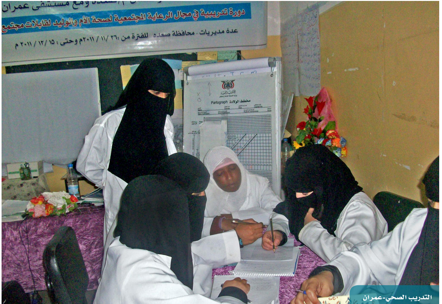
التدريب الصحي- عمران

خفض وفيات الأمهات والمواليد: صُمِّم هذا المكون لتوسيع وتحسين خدمات الصحة الإنجابية من خلال بناء وتجهيز أقسام الطوارئ التوليدية الأساسية والشاملة، ومراكز الأمومة والطفولة، وتجهيز أقسام الخُذج وحديثي الولادة. وفي إطار مشاريع الطوارئ التوليدية الأساسية والشاملة، ومراكز الأمومة الآمنة، تم الانتهاء من الأعمال المدنية واستلام التوريدات وتسليم مشروع، وإعلان وترسية مناقصات... وذلك في محافظات حجة وتعز ولحج والحديدة وعمران وذمار وأمانة العاصمة وتعز. ويجري العمل في تنفيذ مشروع تأهيل 20 قابلة فنية