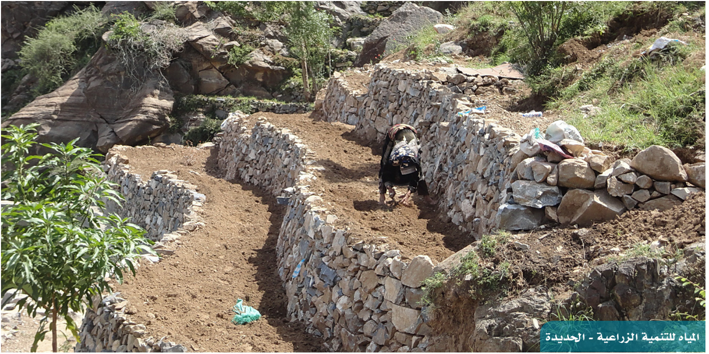
المياه للتنمية الزراعية - الحديدة

تم الانتهاء من إعداد مدرّبات محو الأمية. كما جرى تشكيل فرق المدارس المعززة للصحة في سبع مدارس من سبع مناطق، ويتم حالياً إعداد الدليل العملي للبرنامج الخاص بهذا النوع من المدارس. وروجعت أيضاً المسودة النهائية للخطط الإرشادية للأخصائيين الاجتماعيين لمناطق البرنامج.