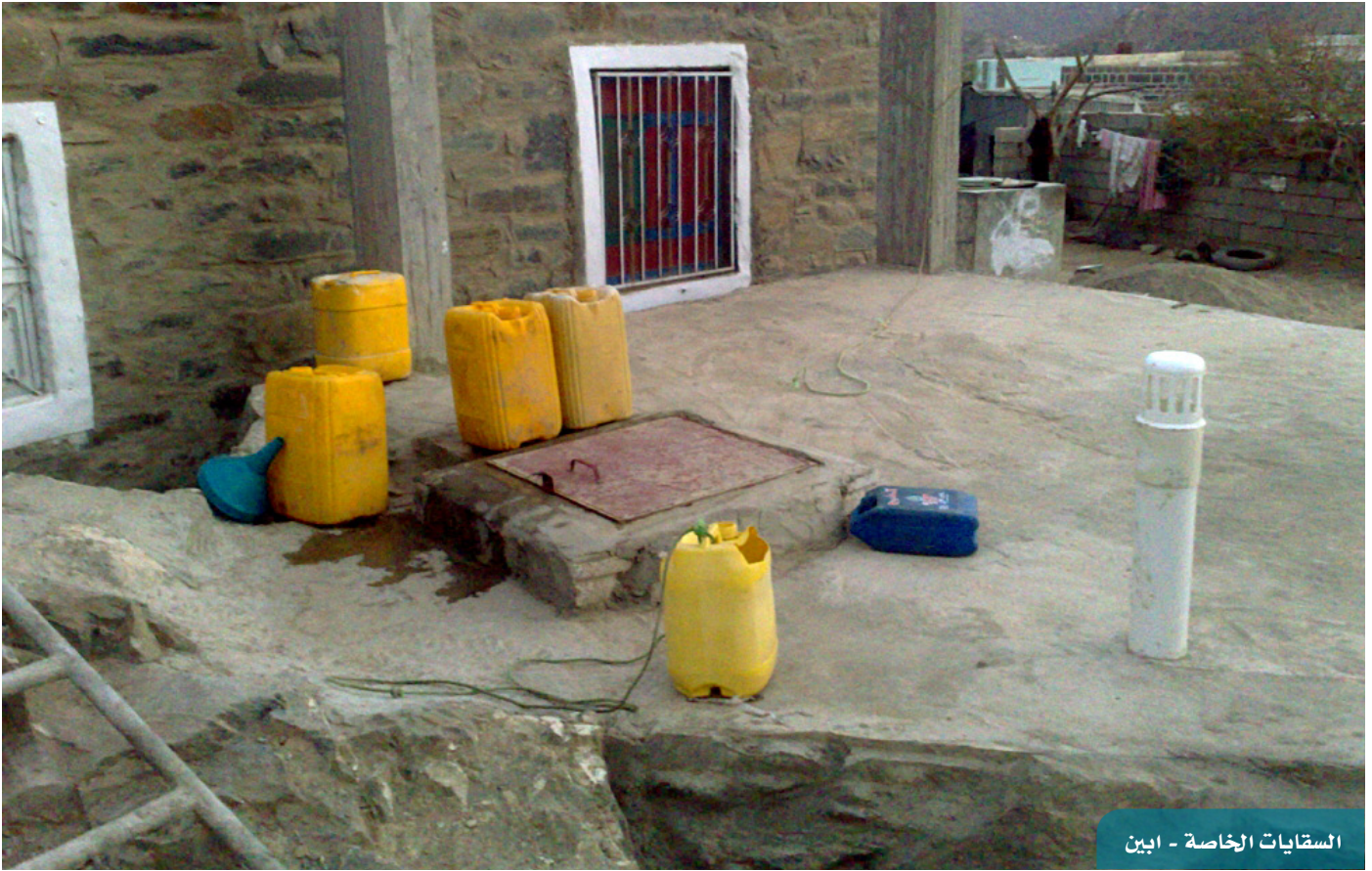
السقايات الخاصة - أبين

وقد تمت الموافقة على جميع المشاريع الممولة من هذه المنحة، ويجري العمل على تنفيذها، وذلك من قبل عمالة