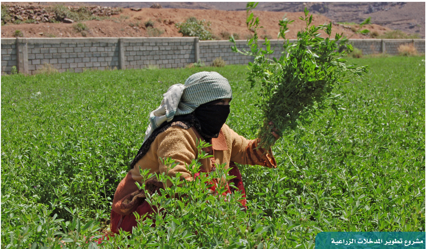
مشروع تطوير المدخلات الزراعية

مشروع تطوير المدخلات الزراعية: نظمت الوكالة 4 دورات تدريبية في عدة مناطق من محافظة لحج، استهدفت 140 مزارعاً، وركزت على استخدام التقنيات الحديثة للمدخلات الزراعية الحديثة لتطوير زراعة الخضار، وأهميتها في تقليل تكاليف الإنتاج وترشيد استخدام المياه وتحسين