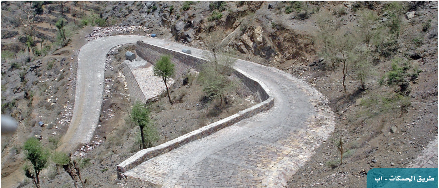
طريق الإسكات - اب